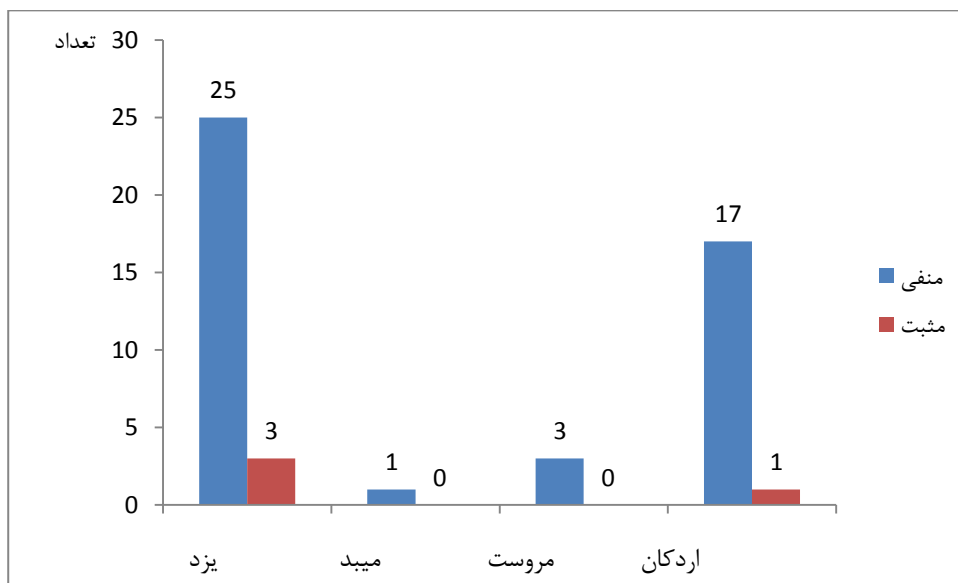
نمودار ۱. توزیع فراوانی باسیلوس سرئوس در نمونه‌های ارده استان یزد.