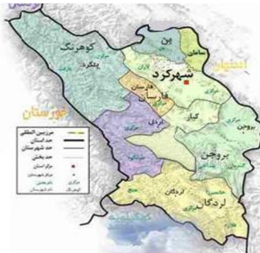
شکل ۱. محل جمع‌آوری نمونه‌های شیر جهت مشخص شدن وضعیت شیوع کوکسیلا بورتتی در شهرستان شهرکرد، ایران.

منطقه مورد مطالعه. مطالعه‌ی حاضر در شهرستان شهرکرد روی نمونه‌های شیر گاو گرفته شده از مخزن شیرگاو‌داری‌های سنتی انجام شد. این شهرستان مرکز استان چهارمحال و بختیاری و از جمله مناطق کوهستانی جنوب غربی ایران است.