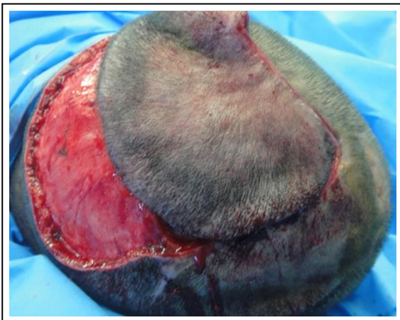
شکل ۲. ترمیم گوش سگی (dog-ear) به صورت اولیه، بدون آسیب به پایه‌ی عروقی و اعصاب حسی.

آمیز به کار رفته است، ولی در مواردی که دفکت عمیق و زخم باز، موجب باز شدن سطح استخوان جمجمه شده یا استخوان دورا را نیز درگیر کرده است، استفاده از فلپ‌های مختلف به صورت فلپ آزاد، ناحیه‌ای و به‌خصوص فلپ‌های موضعی اسکالپ، اجتناب ناپذیر بوده و پس از انجام فلپ‌های چرخشی یا ادوانسمنت و به‌خصوص فلپ‌های انتقالی در ناحیه‌ی اسکالپ، در محل چرخش فلپ دفورمیتی به صورت گوش سگی (dog-ear) ایجاد می‌شود. گوش سگی که به آن tricon و puckering نیز گفته می‌شود، عبارت است از برجستگی و افزایش و تراکم بافت نرم در زاویه‌ی رأس (apical) یا در امتداد طرفین زخم که یک بافت مخروطی شکل برجسته شبیه به گوش سگی را تشکیل می‌دهد (۲). این ضایعه، علل متعددی داشته و در انتهای زخم‌های با طول نابرابر، افزایش زاویه‌ی برش بیش از ۳۰ درجه در انتهای محل ترمیم زخم و در حین انجام فلپ‌های چرخشی (rotation)، جلو بردنی (advancement) و انتقالی (۳) یا نسبت طول به عرض کمتر از چهار به یک در حین رزکسیون دوکی شکل (elliptical)، ایجاد می‌شود (۴). گوش سگی می‌تواند به صورت افزایش بافت در یک طرف زخم یا هر دو طرف آن باشد. انواع کاذب آن (pseudo dog-ear) وقتی اتفاق می‌افتد که چربی زیادی در انتهای یک اکسیزیون در زیر پوست باقی بماند (۳). محل‌های شایع بدشکلی گوش سگی در صورت، اسکالپ، انتهای برش‌های جراحی، ماموپلاستی و ابدومینوپلاستی می‌باشد. اصلاح گوش سگی در صورت، پستان و سایر محل‌های در معرض دید، از نظر زیبایی اهمیت زیادی دارد. بهترین زمان درمان آن، در همان عمل جراحی اولیه می‌باشد. استثنا در این مورد، فلپ‌های انتقالی