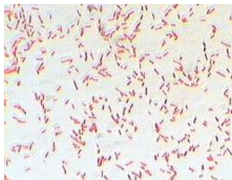
شکل ۱. رنگ‌آمیزی گرم بورخولدريا سپاسیا.

لاکتوباسیلوس پلانتاروم و روتری به آنتی‌بیوتیک‌های ونکومایسین، ایمی‌پنم، سیپروفلوکساسین و سفتازیدیم مقاوم بودند ولی به پیپراسیلین، کلیستین و کوتریموکسازول، حساسیت نشان دادند (جدول ۲).