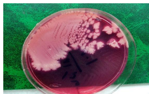
شکل ۱. کلنی‌های بزرگ صورتی با هاله رسوب‌دار باسیلوس سرئوس روی محیط MYP.

برای جدا سازی سالمونلا از مراحل پیش غنی‌سازی از محیط پپتون واتر P.W، مرحله غنی‌سازی از محیط راپاپورت واسیلیادیس (R.V broth) و کشت از محیط هکتون انتریک آگار HEA استفاده شد. سپس از کلنی‌های آبی متمایل به سبز یا بدون مرکز مشکی بسته به نوع سالمونلا تست‌های افتراقی انجام شد. سپس با استفاده از آنتی‌سرم‌های بهار افشان سروگروپ‌های سالمونلا به روش اسلاید اگلوتیناسیون تعیین شد (۱۴). برای جداسازی باسیلوس سرئوس پس از تهیه رقت‌های مورد نظر و تلقیح به محیط MYP (Mannitol egg youlk polymixine agar) و بررسی کلنی‌های مشکوک بزرگ صورتی با هاله رسوب‌دار، وجود همولیزیتا و ایجاد کلنی خشن روی محیط بلاد آگار، حساسیت نسبت به دیسک‌های ونکوماپسین (V) و جنتامایسین (GM)، رشد در دمای ۴۵ درجه سانتی‌گراد و انجام تست‌های بیوشیمیایی استفاده شد (شکل ۱). تمامی محیط‌های مورد استفاده از شرکت مرک آلمان و دیسک‌های آنتی‌بیوتیک از شرکت سیفین انگلستان (SIFIN Antisera-UK) تهیه شده بودند (۱۵).