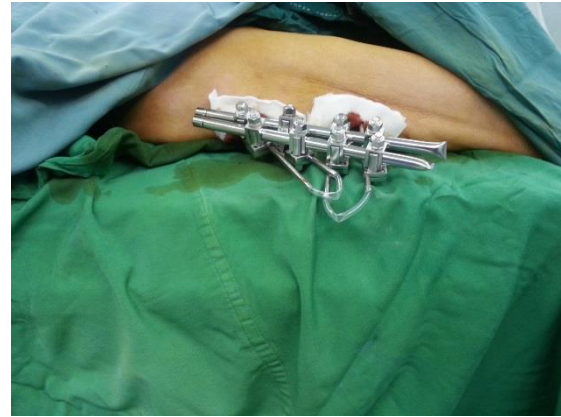
شکل ۳. اکسترنال فیکساتور به خوبی در بیماران پذیرفته شد و هیچ یک از بیماران مشکل جدی برای نشستن و یا خوابیدن نداشتند.

Badras و همکاران، شیوع کمتر میگریشن شانز پین پروگزیمال را به مفضل، در بیماران درمان شده با اکسترنال